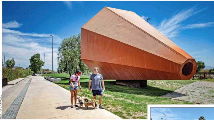
BENEFICIOS. — El espacio contempla la presencia de amplias áreas verdes, con más de seis mil árboles, sectores iluminados y caminos nuevos para los transeúntes.

"Está bien bonito, les dará vida a la comuna y a este sector que, la verdad, no cuenta con muchos espacios verdes. Ojalá que lo inauguren pronto y que los vecinos lo cuiden, porque el principal enemigo somos