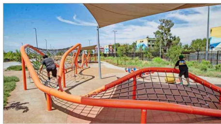
RECREACIÓN. — Hay juegos infantiles, áreas de picnic, canchas deportivas, lagunas artificiales y zonas de descanso, que permitirán la entretención de los vecinos.