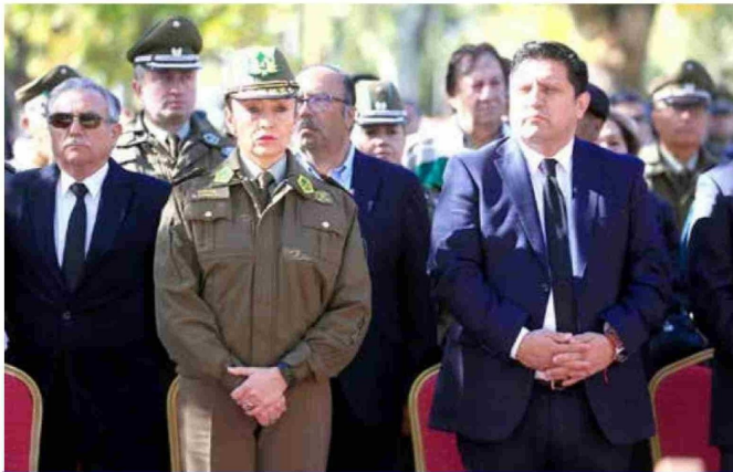
La general de Carabineros, Maureen Espinoza, visiblemente afectada con el triple asesinato de funcionarios policiales, arengó a hombres y mujeres de la institución a "no bajar los brazos" y "seguir trabajando 24/7".

Sergio Arévalo Lobo y Misael Vidal Cid, quienes fueron asesinados y quemados la madrugada de ayer, en Cañete, en la Macrozona Sur, al parecer tras ser víctimas de una emboscada.