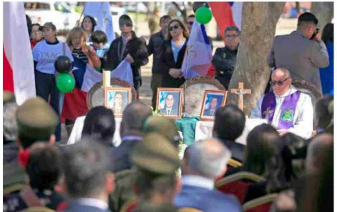
En la ceremonia religiosa se homenajeó a los tres carabineros asesinados en la zona de Cañete, quienes pasaron a abultar la cantidad de mártires de la policía.

y unidos que nunca por el bien de nuestro país. No vamos a bajar los brazos, 24/7 Carabineros de Chile sigue trabajando, desplegado en todo el territorio, pero el apoyo y la presencia de nuestros vecinos hoy día, sin lugar a dudas nos fortalece