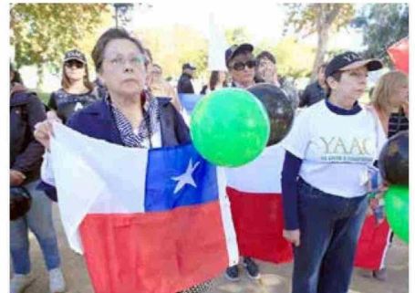
Hasta el acto desarrollado en la Alameda llegó la agrupación "Yo apoyo a Carabineros", para solidarizar con la institución.

Producto de esta nueva tragedia, la institución suspendió las actividades de celebración de este nuevo aniversario, como el desfile que estaba previsto realizar en horas de la mañana.