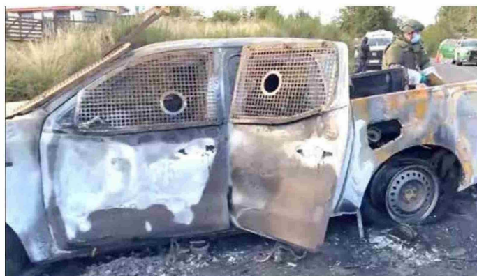
Los malogrados carabineros fueron asesinados y luego quemados junto con el vehículo policial.

Asimismo, señaló que la bancada de la UDI ha solicitado suspender la semana distrital de los parlamentarios, para así poder legislar sobre las leyes de inteligencia y las reglas del uso de la fuerza. Esto, dijo, “para darle mayor amparo institucional, mayor capacidad de encontrar a estos asesinos, para que Chile restablezca el orden y seguridad para todos los ciudadanos y que Carabineros no sea víctima de estos salvajes atentados a la paz”.