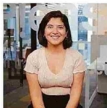
PAULINA POZO COMUNA: VIÑA DEL MAR INNOVACIÓN

cional del voluntariado “Vive Tus Parques” del Instituto Nacional de la Juventud, donde fue encargado de seguridad y apoyo logístico, y también tuvo a su cargo el voluntariado de emergencia a nivel nacional, adquiriendo conocimientos en respuesta ante desastres y gestión de equipos. Estas experiencias lo impulsaron a fundar Línea 50, un proyecto que recicla mangueras en desuso de Bomberos de Quilpué, Villa Alemana, Viña del Mar y Valparaíso, transformándolas en accesorios de alta resistencia. Dice que la coordinación de voluntarios es clave para la conservación ambiental y la gestión de emergencias, y que “con este proyecto, se busca reducir el impacto ambiental del trabajo de Bomberos y fomentar un servicio más sostenible” . ➡