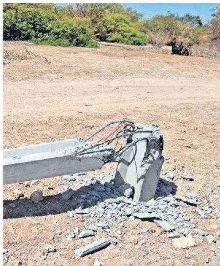
FUE EL TERCER INCIDENTE MASIVO EN MENOS DE TRES MESES.

Según informó CGE, los delincuentes destruyeron 20 postes de la red de distribución eléctrica para sustraer 7.500 metros de cables de cobre y venderlo en el mercado negro. El ataque a la red dejó a 2.647 clientes sin energía. "Se activó un plan especial de contingen-