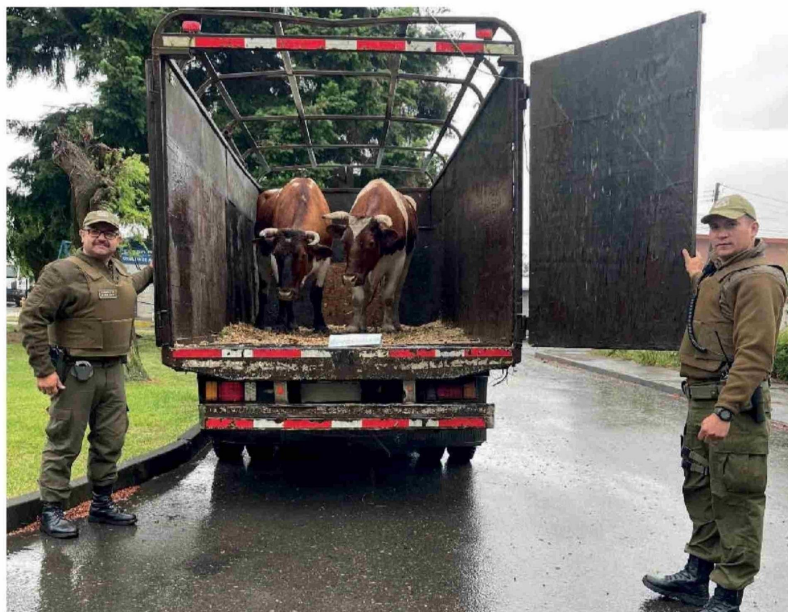
SEGÚN SOCABÍO, la venta ilegal de carne debería facilitar la detección de estos comercializadores de hacerse las investigaciones y seguimientos necesarios.

Por lo mismo, planteó la urgencia de contar con un equipo especial que se aboque a indagar delitos de esa naturaleza en las zonas campesinas: “Estamos