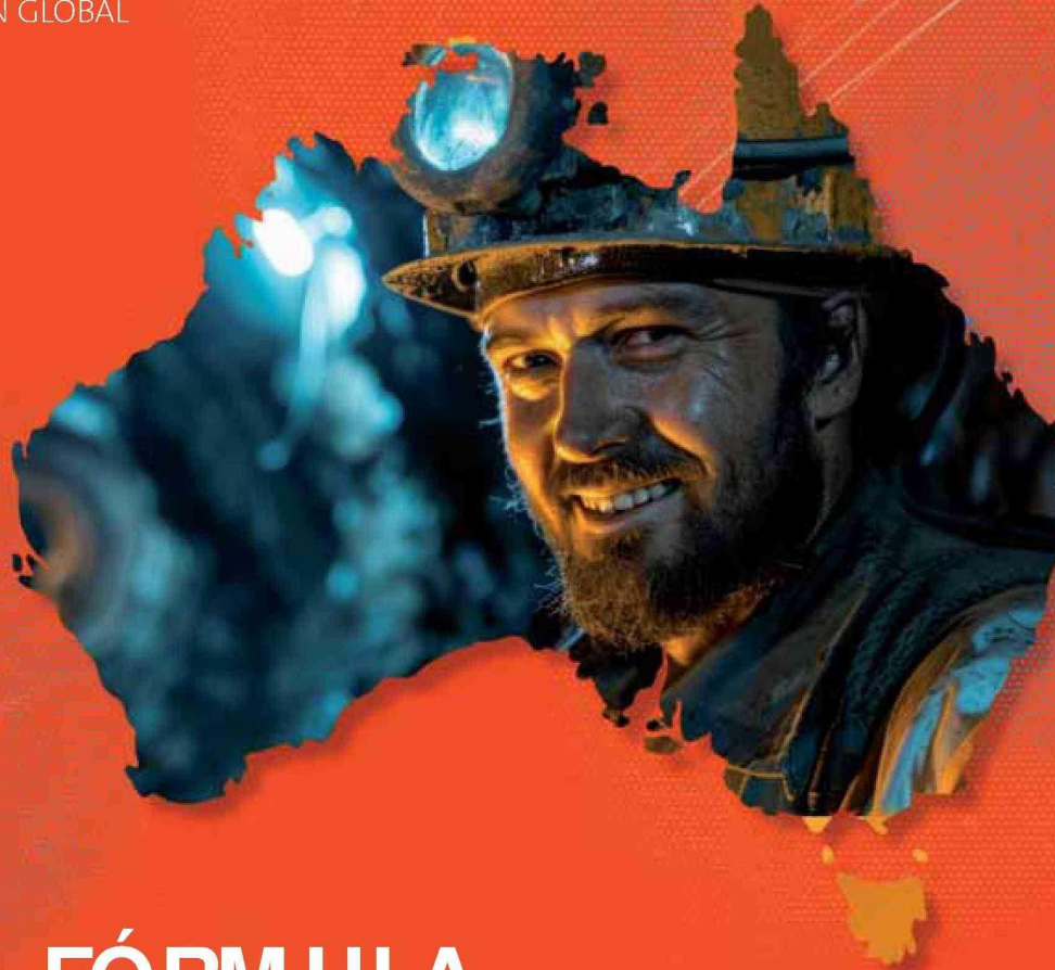
Ilustración: Fabiana Rivero