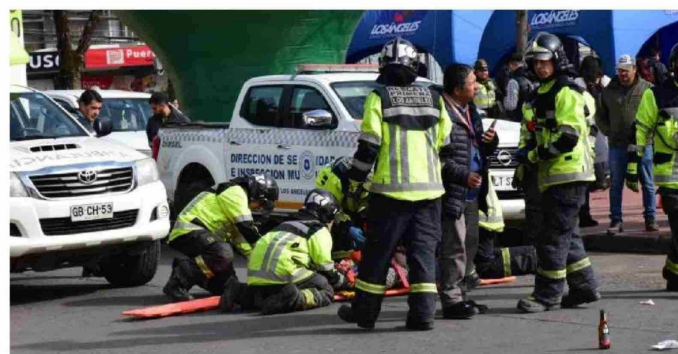
LOS EQUIPOS DE EMERGENCIA demostraron el trabajo frente a las colisiones, choques y atropellos.

física, también hay primeros auxilios para abordar las consecuencias de distintas situaciones, en este caso un accidente u otro tipo de desastres, hoy con una fragilidad en nuestra salud mental, donde no hay garantías de que sepamos sobrellevar una situación de tal impacto emocional".