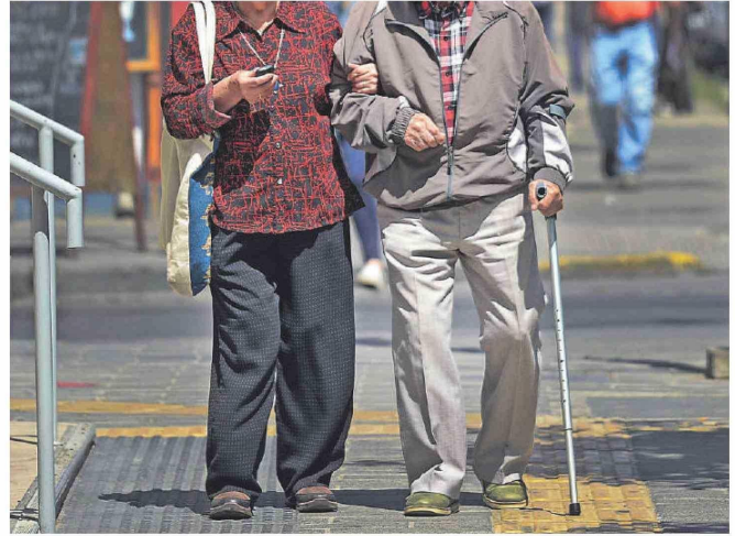
Bajas pensiones e inflación, una mezcla que complica a las personas mayores.

Y añade con respecto al rango etario de este informe que "sin duda, esta entrega tiene rostro de adulto mayor. La morosidad es un termómetro del funcionamiento de la economía, y hoy la actividad y la inversión aún no repuntan. Además, las proyecciones siguen siendo mediocres en materia