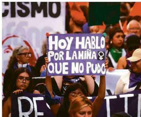
ESTE FIN DE SEMANA SE CONMEMORÓ UN NUEVO 8M.

implementar la Ley de Violencia Integral, que este 6 de marzo cumplió un año desde su aprobación en el Congreso, la cual tiene componentes multisectoriales para el aseguramiento de la vida de las mujeres en diferentes ámbitos.