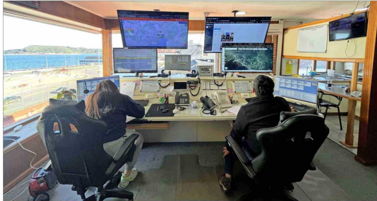
En la central de Bomberos (en la foto, en Puerto Montt), Viper automatiza el proceso de despacho de voluntarios y vehículos.