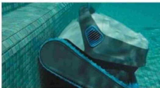
Un robot que limpia su piscina. Su valor en el mercado puede ir desde los $400 mil a $1.500.000.

pertos analizaron las implicancias de esta transformación y advierten sobre los desafíos que plantea.