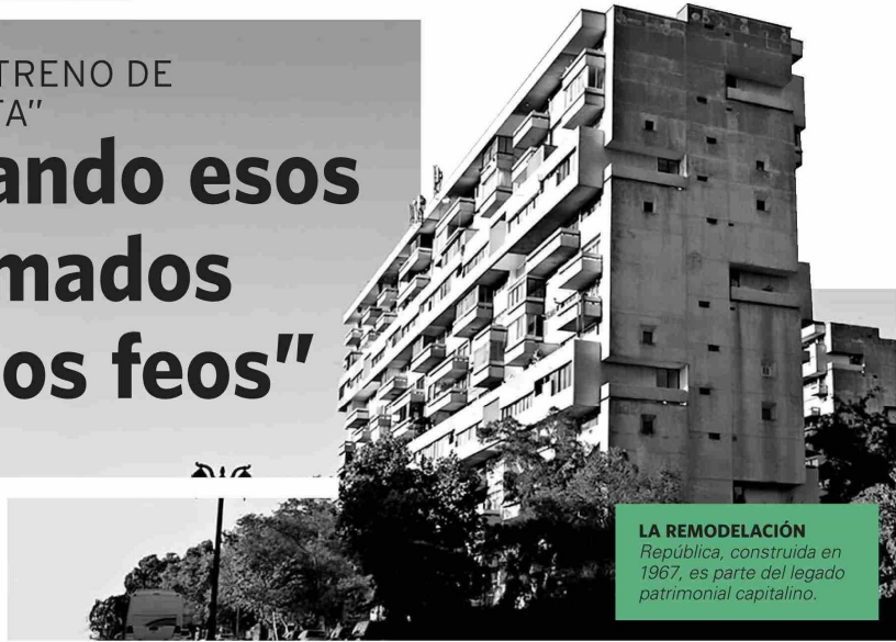
LA REMODELACIÓN República, construida en 1967, es parte del legado patrimonial capitalino.