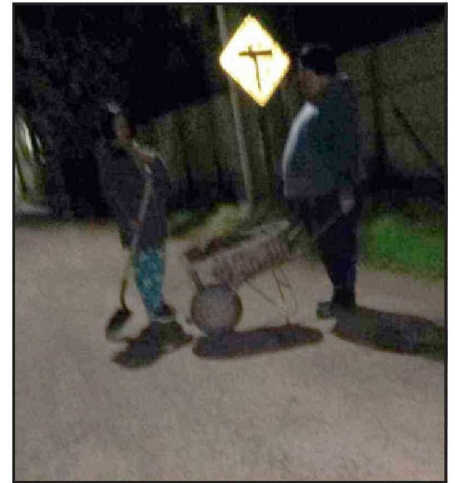
A pesar de lo oscuro, se puede apreciar a un vecino con carretilla para tapan los hoyos. Iniciativa propia.

- Supuestamente, tenemos entendido que divide el canal que pasa por la calle El Sauzal. Usted lo pasa y pertenece a San Felipe y si lo pasa hacia arriba, a Los Andes.