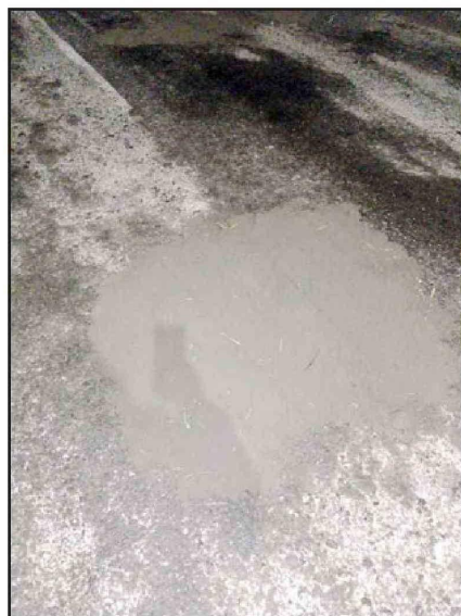
Acá una muestra de la iniciativa desplegada por vecinos; un hoyo tapado por ellos.

sulta que ahí supimos que había venido la alcaldesa por estos sectores, solamente se reunió con la Junta de Vecinos perteneciente a San Felipe y la directiva no le dijo a ningún vecino que iban a venir por estos sectores. Pasa al frente