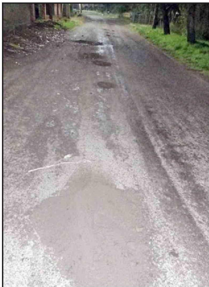
Una verdadera zona de cráteres.