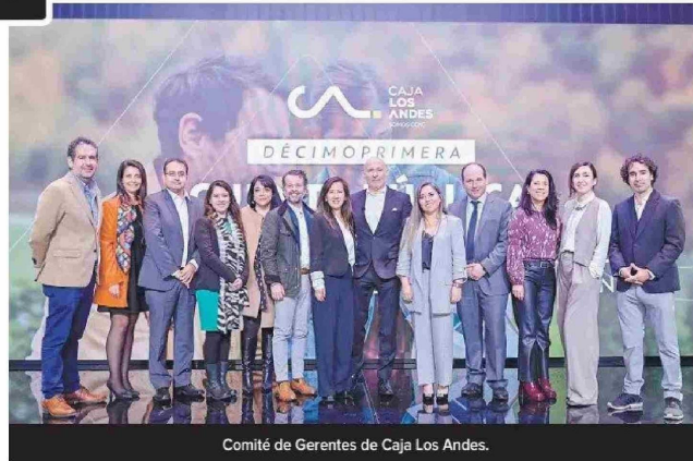
Comité de Gerentes de Caja Los Andes.