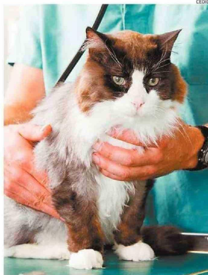
QUIENES MANEJEN MASCOTAS DEBEN ESTAR CAPACITADOS.