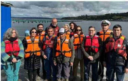
INSTITUCIONES QUE PARTICIPAN DE LA PARTIDA DEL ACUERDO.

AmiChile suma una segunda iniciativa en la línea de disminuir su impacto ambiental, comprometiéndose a intentar reducir el consumo de agua dulce y a la gestión y valorización de los residuos de la actividad concentrada en la zona.