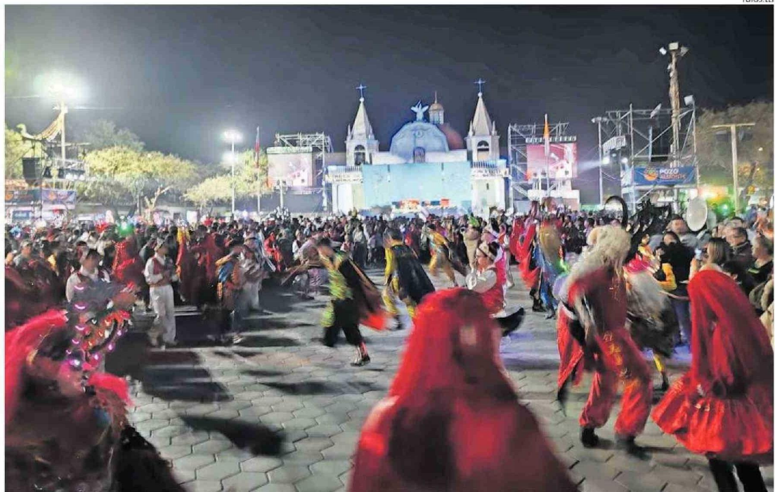
UNA EXPLANADA REPLETA LUCIÓ LA TIRANA AYER POR LA VÍSPERA.

Por otro lado, el jefe comunal agregó que desde el 1 de julio han estado realizando un trabajo exhaustivo, coordinando lo que es el manejo del agua potable para el poblado, seguridad, barrido de calles y retiro de basura domiciliaria. Respecto a esto último, aseguró que han retirado varias toneladas de desechos, “mientras que en materia de entrega de agua llevamos 2 millones de litros distribuidos”.