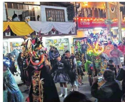
LAS DIABLADAS SE ROBARON LAS MIRADAS.

ra el balance ha sido positivo. Esperamos seguir dotando de mayor infraestructura y servicios al pueblo con el Plan La Tirana conformada por distintos organismos públicos, que ya ha dado sus primeros frutos como la renovación de la explanada que está en camino y man-