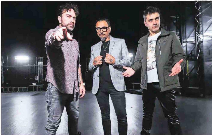
EL GRUPO PROMETE TEMAS INÉDITOS Y REVERSIONES DE SUS CLÁSICOS PARA LAS PRESENTACIONES VENIDERAS.

Y es esa misma energía lo que llevó a Lucybell no solo a continuar creando temas, sino que trayendo además diferentes giras, como lo es Tour Sesión 3000, que mezcla tanto la creación de nuevas composiciones, como un viaje que los