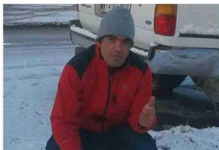
EL CUERPO DE LA VÍCTIMA LLEGABA ANOCHÉ A LA ISLA TRANQUÍ

Asimismo, González relató que los compañeros del isleño lo rescataron. “Tras subirlo a la cubierta de la lancha, verificaron que estaba sin vida, notificando el hecho vía telefónica a la Capitánía de Puerto de Punta Arenas, que ordenó el retor-