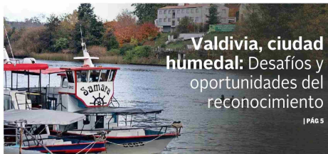
Valdivia, ciudad húmedal: Desafíos y oportunidades del reconocimiento