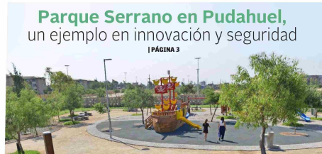
Parque Serrano en Pudahuel, un ejemplo en innovación y seguridad