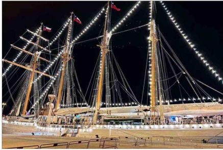
La embarcación arribó la mañana del viernes a España.