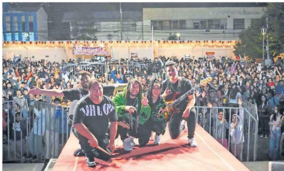
Una de las jornadas más concurridas fue "La noche de gloria" para la comunidad cristiana grande en Lebu, y que se incluyó especialmente.