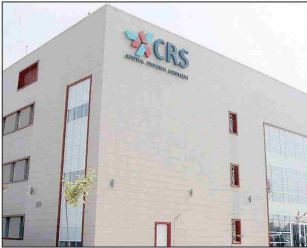
Hospital Provincia Cordillera, ubicado en Eyzaguirre 2061, Puente Alto.