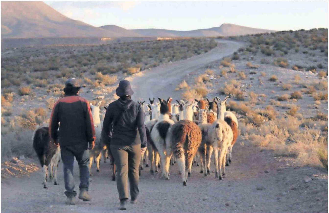
VAN 45 MUERTES DE LLAMAS, PRODUCTO DE LOS ATAQUES DE LOS PUMAS, REGISTRA LA COMUNIDAD DE CASPANA.