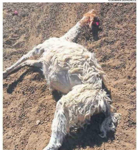
LOS POBLADORES QUIEREN APOYO DE LAS AUTORIDADES.

dan desarrollar las medidas necesarias para proteger sus ganados.