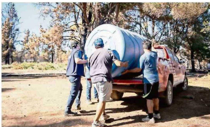
EL GOBIERNO REGIONAL Y EL MUNICIPIO DE PINTO TRABAJAN EN LA ENTREGA DE AYUDA.