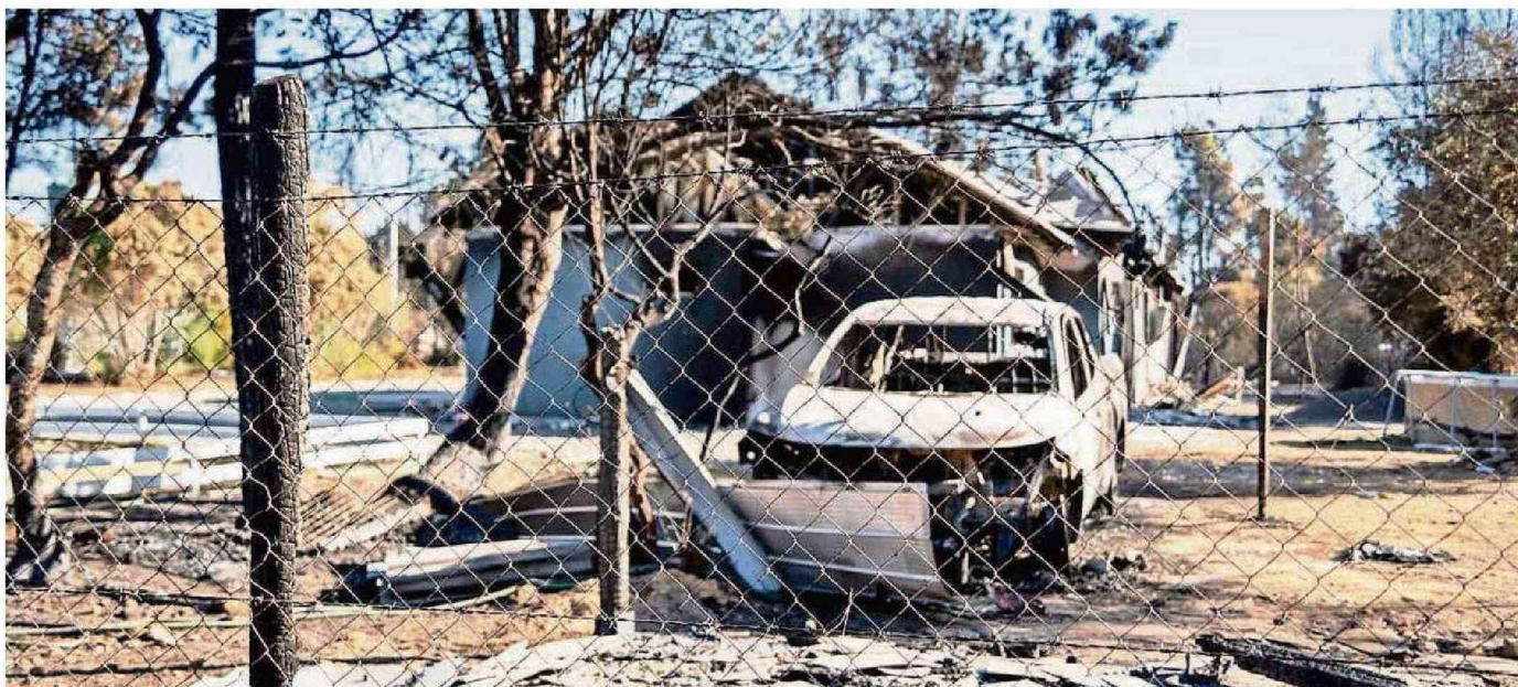
LAS LLAMAS DEJARON A SU PASO ESTRUCTURAS CALCINADAS Y FAMILIAS DAMNIFICADAS.