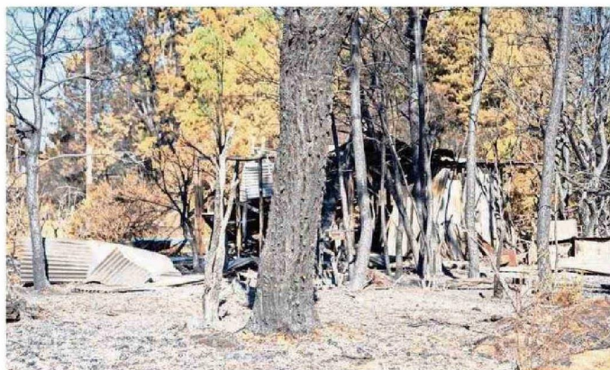
VIVIENDAS REDUCIDAS A ESCOMBROS EVIDENCIAN LA MAGNITUD DE LOS INCENDIOS FORESTALES EN ÑUBLE.