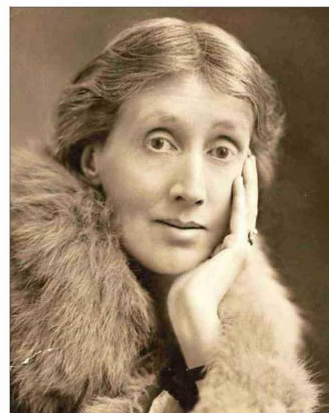
De Virginia Woolf es "El cuarto de Jacob".