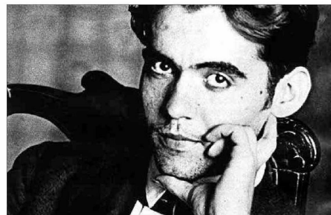
"Primeras canciones" es la obra de García Lorca que se incluye.