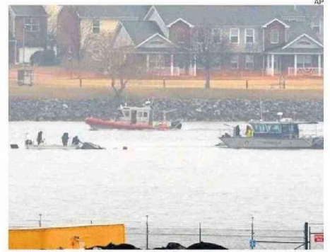
MIEMBROS DE EQUIPOS DE RESCATE AÚN BUSCAN A 14 DESAPARECIDOS.