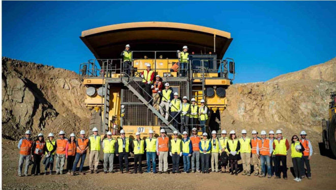
Uno de los principales objetivos de CAP es ser líderes en el mercado global de los materiales para la descarbonización, a través de un portafolio integrado de negocios y el desarrollo de productos y soluciones innovadoras y sostenibles, siempre al servicio de su propósito de crear bienestar y progreso compartido.

"Estos avances son reflejo del compromiso de CAP con un