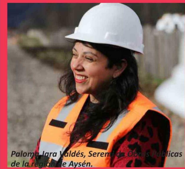
Paloma Jara Valdés, Seremi de Obras Públicas de la región de Aysén.

De esta manera, la labor tanto de los dirigentes/as y los trabajadores/as es muy valiosa, puesto que con su servicio, dedicación y trabajo, garantizan el acceso al agua potable en los diversos territorios rurales de la región de Aysén.