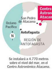
Se instalará a 4.770 metros sobre el nivel del mar, en el Centro Astronómico Atacama.

Fuente: Proyecto SWG0, Claudio Dib. Crédito de la imagen: Richard White