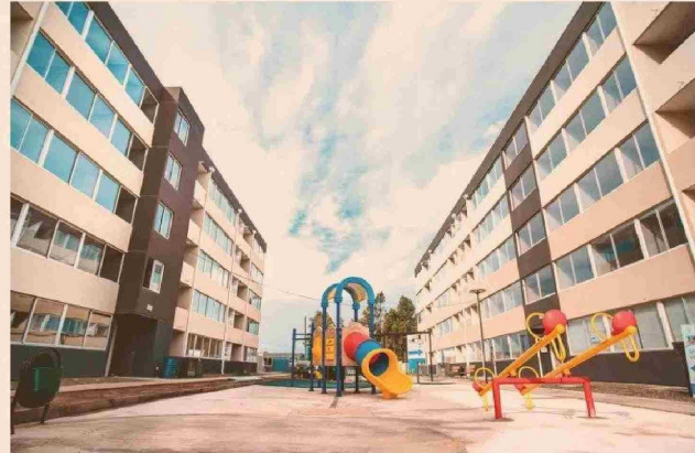
El sello de los proyectos de Brio y Nevasa es que privilegian los espacios comunes y las áreas de recreación, además de las energías renovables y materiales sustentables.

INMOBILIARIA Y CONSTRUCTORA BRIO S.A JUNTO A NEVASA: