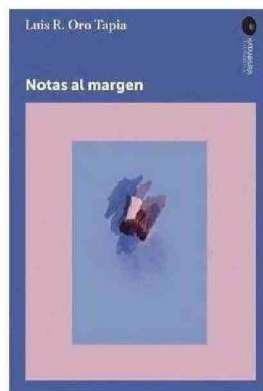
EL LIBRO "NOTAS AL MARGEN" REFLEXIONA SOBRE EL MOMENTO POLÍTICO Y SOCIAL ACTUAL Y SOBRE EL ROL DE LA GENERACIÓN DE LOS 80.