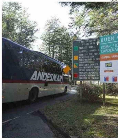
PUYEHUE SE BENEFICIA DE LAS DELEGACIONES QUE VAN HACIA ARGENTINA.

de servicio más tiene ahora la comuna de Puyehue, con lo que la carga de combustible se hace más expedita, sobre todo para el gran flujo de turistas que ya está llegando.