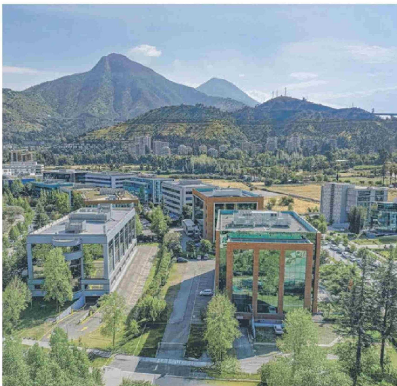
Campus Ciudad Universitaria de la USS en Huechuraba.

y Facultad de Ciencias de la Naturaleza.