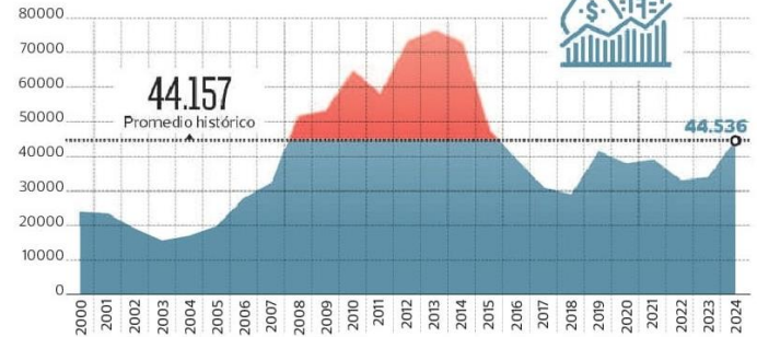
Estimación inversión privada en cuatrienio En US$ MM, cuatrienio considerando año en curso