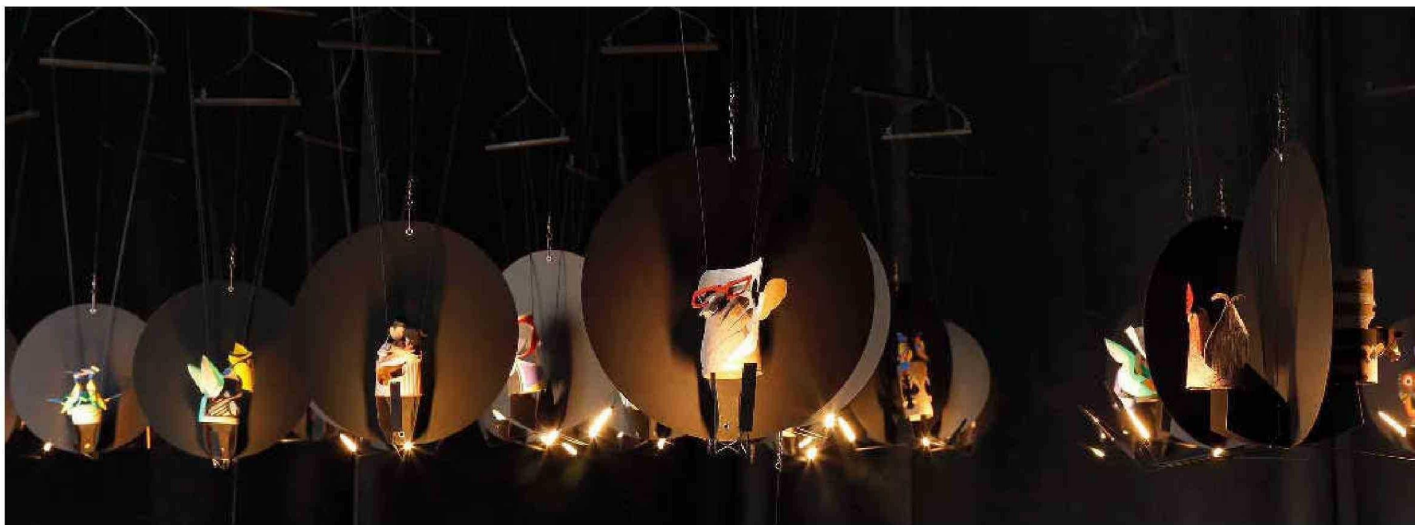
Los seres de Lang penden del cielo, formando un bosque animado.