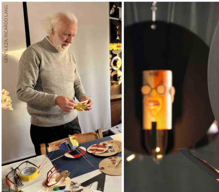
GENTILEZA, RICARDO LANG

Texto, Soledad Salgado S. Fotografías, Carla Pinilla G.