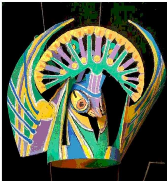
“Hubo desafíos: cómo levantar el pico, cuántas alas sacar, etc.”, dice.

Fue un total goce creativo –cuenta desde su casa en Ritoque, donde es miembro de la Corporación Cultural Amereida desde 1982.