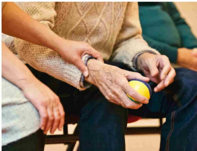
► El país deberá enfrentar desafíos como el impacto en el sistema de salud y pensiones.

El investigador de CIPEM, explica que esta diferencia se debe a una menor mortalidad en mujeres, condicionada por factores fisiológicos, socioculturales y conductuales. "Los factores genéticos, los estilos de vida más saludables y una mayor prevención influyen