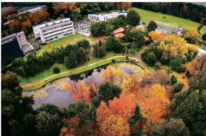
Campus San Juan Pablo II