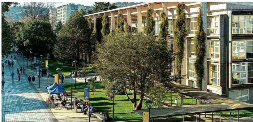
Campus San Francisco.