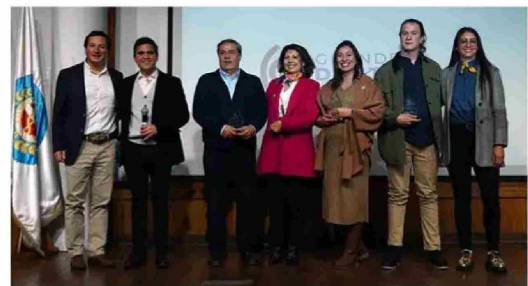
"Grandes Dentistas" es un premio que destaca a odontólogos en ámbitos como Docencia, Trayectoria, Talento Joven y Trabajo Social.

galardón es que la postulación es abierta, permitiendo a toda la comunidad nominar sus candidatos, quienes posteriormente son evaluados por un jurado compuesto por especialistas, expertos académicos y autoridades.