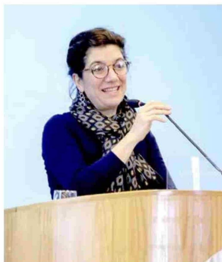
Ministra de Ciencia, Aisén Etcheverry.

Titular de Ciencia. La autoridad de Gobierno participó en el seminario Ciencia en el Aire y que además, contó con exposiciones de importantes divulgadores científicos.