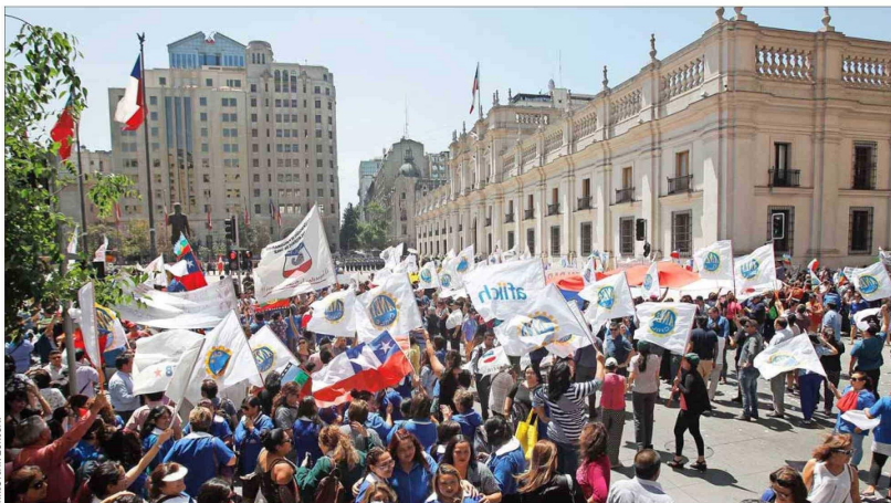
Los empleados públicos esperan negociar con el Gobierno en la discusión del reajuste del sector público, la determinación de plazos por ley para la confianza legítima en las contrataciones.

A fines de 2014 llegaban a 144.449 y a junio de este año casi se han duplicado a 274.350. Más de la mitad de estos empleados a plazo fijo se concentra en el sector salud. Expertos urgen por reforma al régimen del trabajo público.