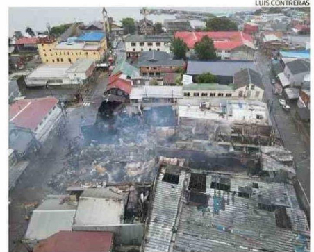
A LA LUZ DEL DÍA SE APRECIABA LA MAGNITUD DE LA EMERGENCIA.

“Ante el gran incendio en el centro comercial Paseo Plaza Ancud, en dicha comuna de la Isla de Chiloé, estamos trabajando para superar la emergencia y apoyar a los afectados. Al equipo de gobierno que está desde temprano (ayer) en terreno se sumará mañana (hoy) el ministro @JuanCaMunozA.”, escribió en su cuenta de la red social, Carolina Tohá, ministra