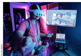
La UDLA exhibió una aplicación de realidad virtual que ayuda a personas de la tercera edad con deterioro cognitivo. Todos los asistentes la pueden probar.