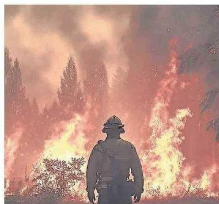
LOS INCENDIOS CAUSAN MUCHÍSIMA CONTAMINACIÓN AÉREA.

-En Chile, los lugares con más concentración de contaminantes están en las llamadas "zonas de sacrificio", como en la zona de Puchuncaví y Quintero, los residuos de relaves mineros de Codelco en Chañaral y otras minas en la Región Metropolitana, los grandes depósitos ilegales de ropa usada en el desierto de Atacama en Alto Hospicio, la contaminación atmosférica causada en las ciudades sureñas por el uso de la leña en gran escala, y el grave problema de gestión de residuos sólidos