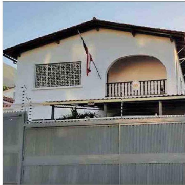
El consulado de Chile en Caracas dejó de funcionar ayer, por solicitud del gobierno venezolano.

Los dos consulados cumplían un rol clave para los chilenos residentes en ese país, que se estiman en cerca de 12 mil personas, las que a partir de ayer están privadas de poder contar con aten-