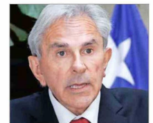
CAROLINA TOHÁ MINISTRA DEL INTERIOR

“Es la concreción de que Venezuela no quiere saber nada de nosotros. Es lamentable no tener relaciones con un país hermano”.