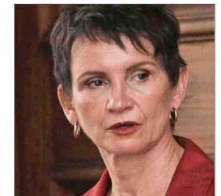
ALBERTO VAN KLAVEREN MINISTRO DE RELACIONES EXTERIORES

“Uno esperaría que los procesos de las diferencias políticas no se resuelvan a través de la interrupción de las relaciones diplomáticas”.