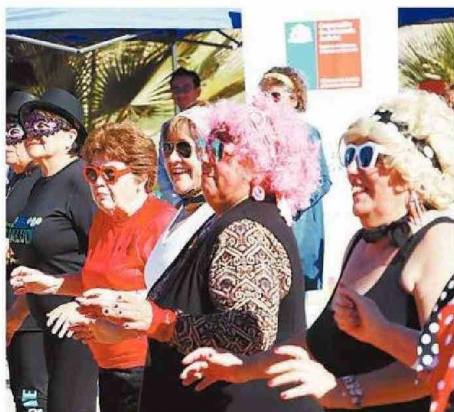
LA ALEGRÍA FUE TOTAL EN LA JORNADA.