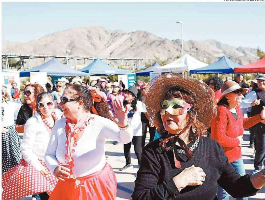
ADULTOS MAYORES OCUPARON DISFRACES PARA SER PARTE DE LA ACTIVIDAD.