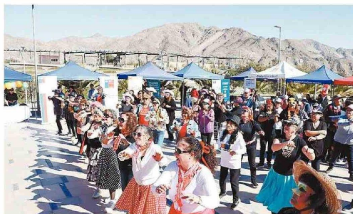
DECENAS DE PERSONAS FUERON A LA CITA.