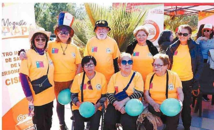
SE AGRADECIÓ LA INICIATIVA.