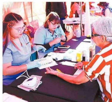
SE PUDIERON REALIZAR EXÁMENES PREVENTIVOS.