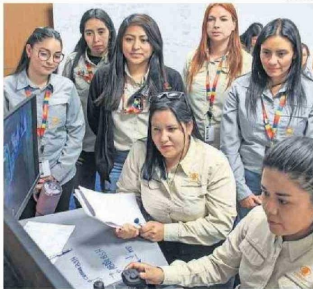
A MÁS DE 30 KILÓMETROS ELAS OPERAN LOS "JUMBOS".