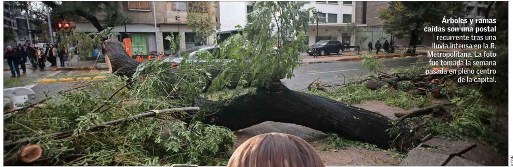
Árboles y ramas caídas son una postal recurrente tras una lluvia intensa en la R. Metropolitana. La foto fue tomada la semana pasada en pleno centro de la capital.

Un árbol puede caerse por distintas razones. Los especialistas coinciden en que una de ellas es porque son