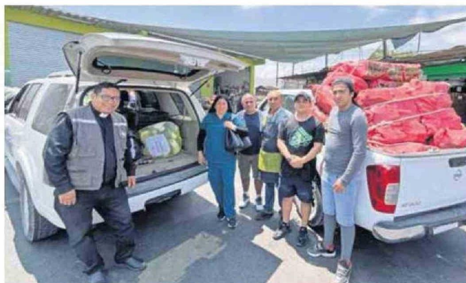
CALAMEÑOS RESPONDIERON EL LLAMADO A COLABORAR EN LAS CAMPAÑAS SOLIDARIAS.

Como respuesta, la Dirección Regional del Senapred actualizó la Alerta Amarilla para la provincia de El Loa y las comunas de Antofagasta, Sierra