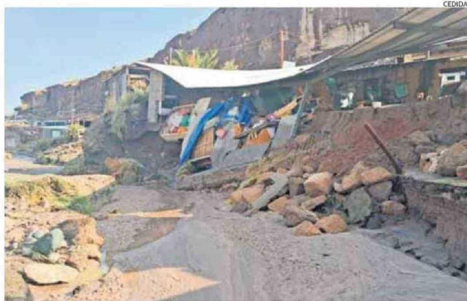
UNA DE LAS CASAS AFECTADAS POR LAS LLUVIAS Y EL DESBORDE DE LOS RÍOS EN EL PUEBLO DE CASPANA.