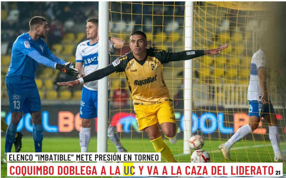
ELENCO "IMBATIBLE" METE PRESIÓN EN TORNEO

COQUIMBO DOBLEGA A LA UC Y VA A LA CAZA DEL LIDERATO 21